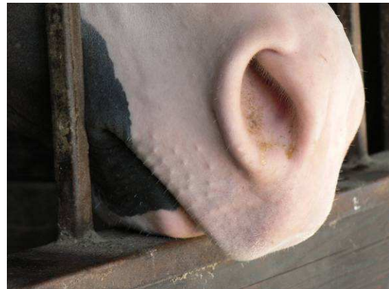
Couper les vibrisses est une atteinte à la dignité du cheval

L'évaluation des risques potentiels est une étape indispensable de l'analyse d'une question éthique lorsque l'on doit assumer une responsabilité personnelle. En fonction de la probabilité et de l'intensité du dommage, le risque peut être négligeable, faible, modéré, élevé ou catastrophique. De plus, la perception subjective du niveau du risque associé à une activité est une troisième variable. Elle peut varier d'un individu à l'autre, par exemple en fonction de l'aptitude de chacun à anticiper.