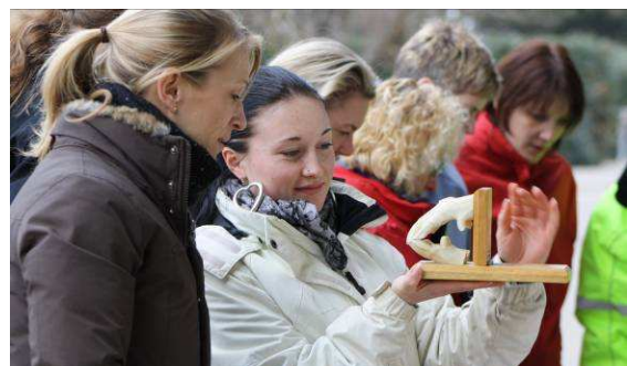
L'acquisition continue de connaissances étendues sur le cheval