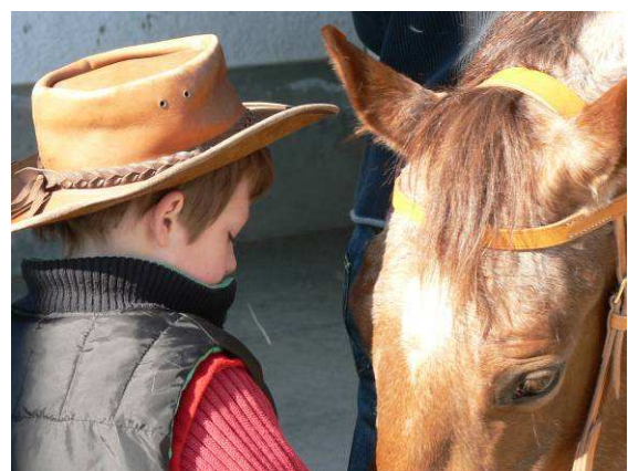
Sensibiliser sans accuser

Pour terminer, le législateur doit poursuivre ses efforts visant à améliorer le bien-être des équidés et le respect de leur dignité, avant tout lors de leur utilisation. Par le biais de financement de projets de recherche et de communication, il doit encourager les acteurs de la filière à réfléchir sur les questions éthiques et les aider à prendre des décisions. En cas de défaillance, le législateur doit d'abord éditer des directives, puis, si nécessaire, les rendre contraignantes dans des dispositions légales.